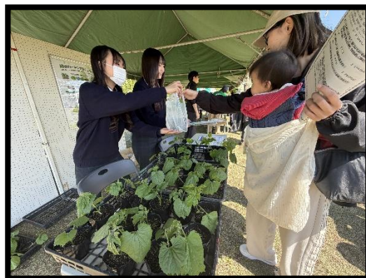
フェスティバルの様子