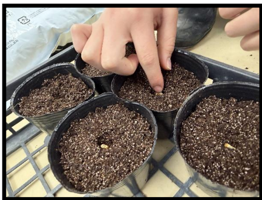
播種（はしゅ）の様子（3/30）